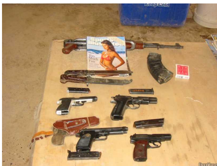
“ at least they have good reading material “ [i]

Die Seite undermars.com [i] versteht sich selbst als apolitisches Bilderarchiv für US Soldaten im Einsatz im Irak. „ This site aims only to visually document their experiences ... .“ Jeder kann seine Bilder hochladen. Es wird weder zensuriert noch editiert. Alles geschieht anonym. So entsteht eine wahre Bilderflut von über 1400 Bildern. Das Spektrum ist breit, angefangen von Genreaufnahmen von Soldaten und Panzern über urlaubsähnliche Schnappschüsse bis hin zu schockierenden Bildern von Leichen und abgetrennten Armen und Beinen.