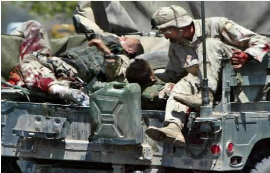
„US Soldiers in Iraq“ [c]

Das Bild eines amerikanischen Mannes führte mich zu einer Seite [d] von amerikanischen Schulkindern, die sich mit dem Irakkrieg beschäftigten und ihre Forschungsergebnisse auf diese Weise veröffentlichten. Das Bild, in schwarz-weiß, zeigt einen Mann in einer Gruppe von Menschen. Er trägt ein Schild mit der Aufschrift: „ Bush [...] my son died! “. Dieses Bild ist eines der wenigen, die ich auf meiner Google-Suche gefunden habe, die das Leid der Angehörigen von verstorbenen Soldaten thematisieren.