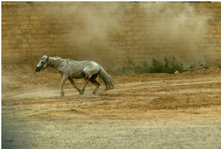
Suchbegriff: „iraq war“

Interessant waren zwei Fotografien, gefunden durch die Stichwörter “iraq 2003” und “iraq war” . Es handelt sich jeweils um flüchtende Tiere. Die eine Fotografie zeigt ein Pferd mit klaffender Wunde am Bein, im Hintergrund eine Steinmauer und aufgewühlter Staub. Bei der zweiten Fotografie handelt es sich um ein Kamel in einer Wüstenlandschaft. Von dem Tier beinahe verdeckt ist eine Explosion und eine daraus entstehende Rußwolke zu sehen. Das Bild wirkt beinahe ästhetisch. Der Bildaufbau beider Fotografien ist sehr ähnlich. Das Tier steht im Mittelpunkt. Kampfhandlungen werden nicht explizit gezeigt. Kein Soldat ist zu sehen. Doch veranschaulichen beide Bilder für mich sehr deutlich, dass der Krieg nicht nur Tausende Menschenopfer fordert, sondern auch die gesamte Umwelt beeinflusst und beeinträchtigt.