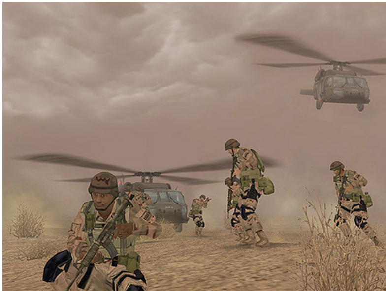
Screenshot America's Army Operations [g]

Köpfe hinweg. Explosionen und Rauchschwaden sind im Hintergrund zu erkennen. Das Spiel sollte so realistisch wie möglich sein. Die computergenerierten Bilder sind allerdings, frei von Dreck, Blut und zerfetzten Körpern oder auch Schreien und Lärm, abgesehen von den abgefeuerten Schüssen und Explosionen [11].