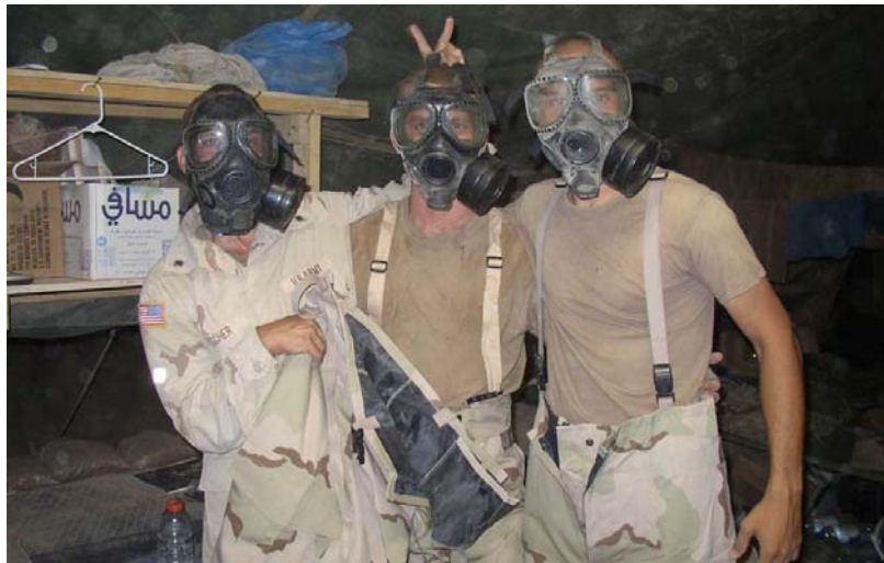
Posieren mit Freunden [a]